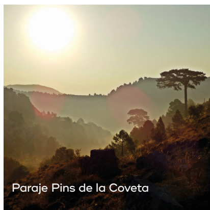
Paraje Pins de la Coveta

Castell de Cabres es la puerta de entrada a la Tinença de Benifassà. Rodeado de valles y montañas, su entorno natural es ideal para dejarse envolver por la naturaleza. Además, esta localidad destaca por su tranquilidad y por disponer de una interesante oferta de turismo rural, que permite disfrutar de un pueblo en el que el tiempo parece congelado.